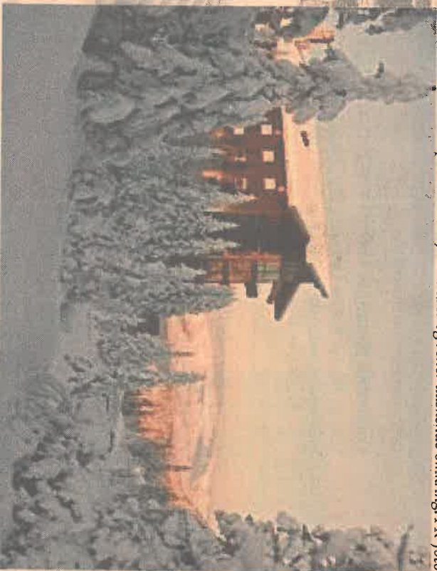
Hotellerne i Åre er placeret, så bygningerne falder godt i med landskabet.