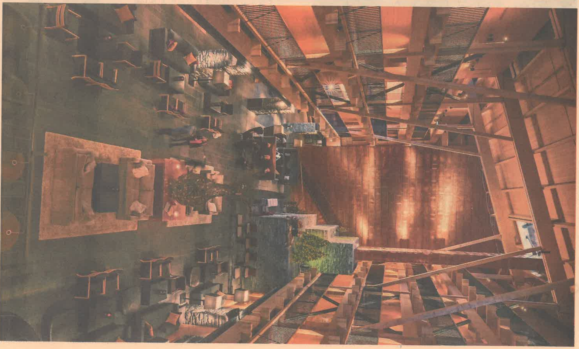
Copperhill Mountain Lodge har spaafdelinger, bar, restaurant, fitness og helikopterlandingsplads.

er vi stødt på så sammenhængende en oplevelse af kvalitet, æstetik og lækhed både i byen og på pisterne. Her er ingen kantiner, hvor du betaler masser af penge for dårlig spagheti bolognese.