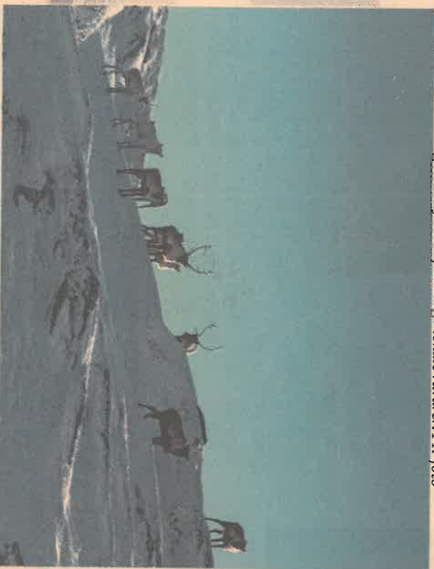
Åre er en stor naturoplevelse med frosne søer og rener daskende omkring.