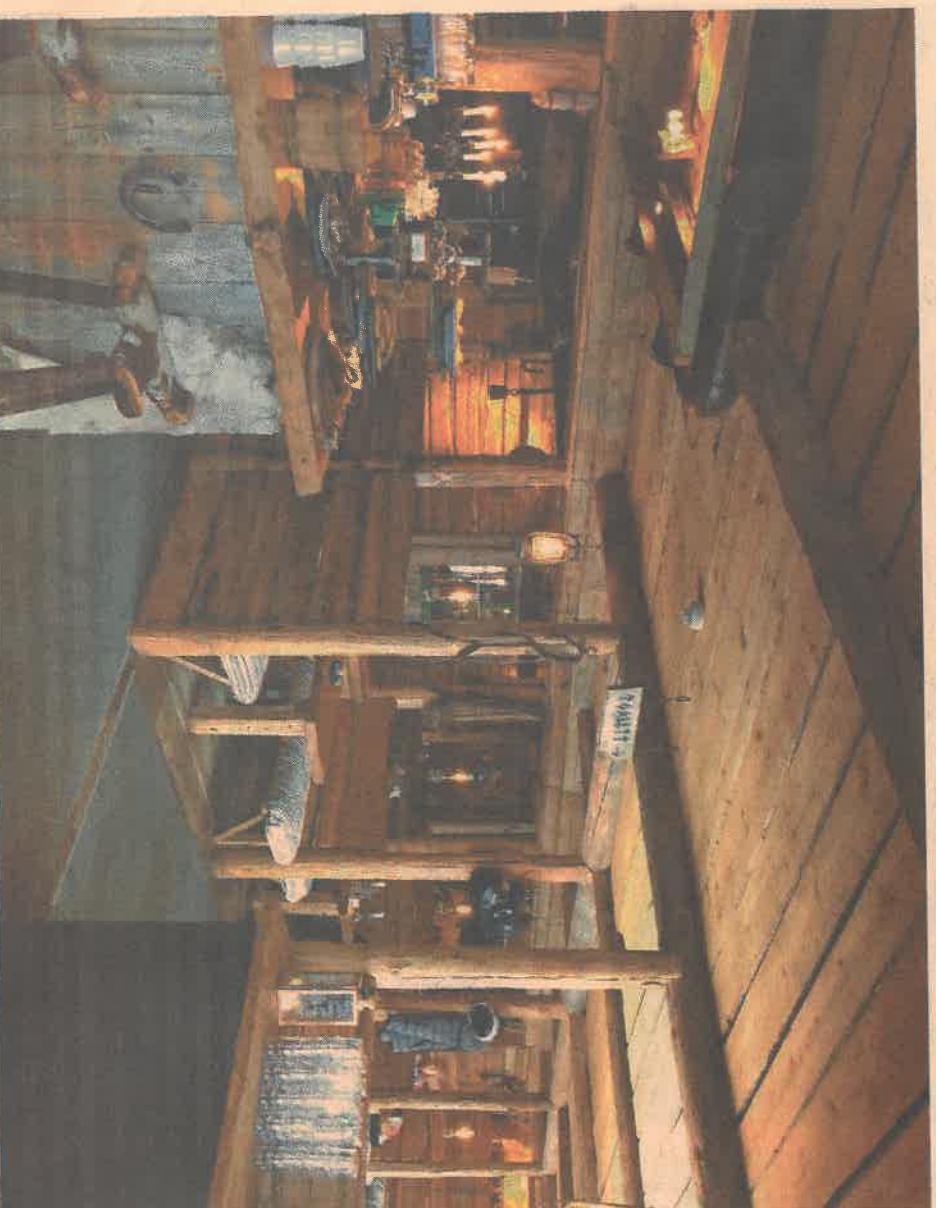
Restauranter og caféer på pisterne er alle af høj kvalitet, både hvad mad, drikke og indretning angår.

Især har kokken Magnus Nilsson og hans tostjernede michelin-restaurant Fäviken en halv times kørsel fra Åre været med til at sætte sit præg på byen