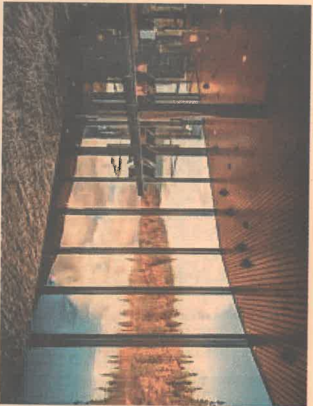
Restauranterne i Åre sør for en dyd ud af at bruge lokale råvarer. PR-foto