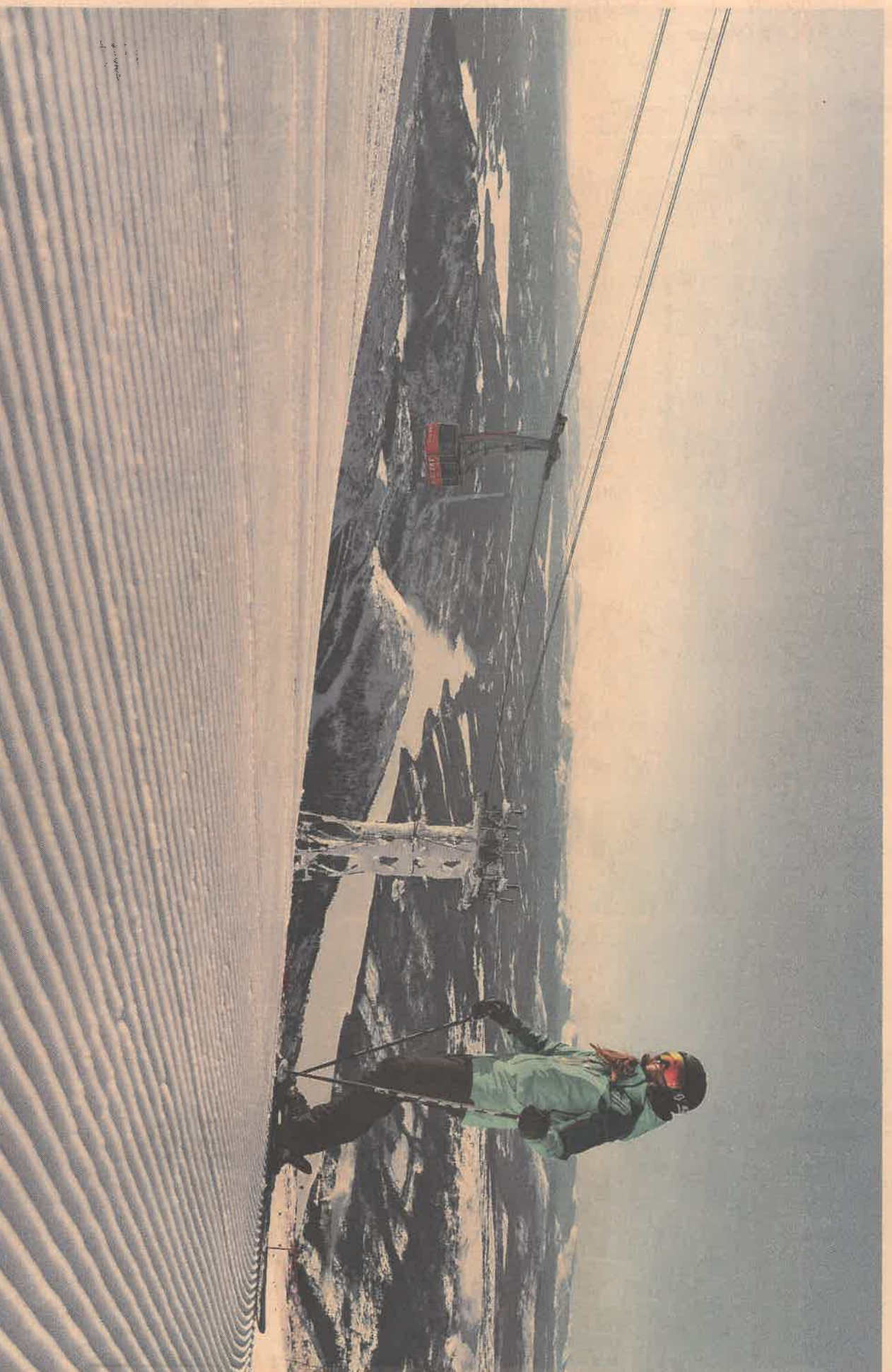
Der findes 100 km pister i Åre, der dermed er Nordens klart største skiområde. I uge 7 og 8 lægger området sne til VM i alpin.

Nybyggede luksushoteller og velbevarede af slagsen med 120 år på bagen. Kvalitetsrestauranter på pisten og hyggelige træhuse på torvet. Læg hertil snegaranti i Nordens største skiområde, som du nu kan flyve direkte til. Åre er en unik destination