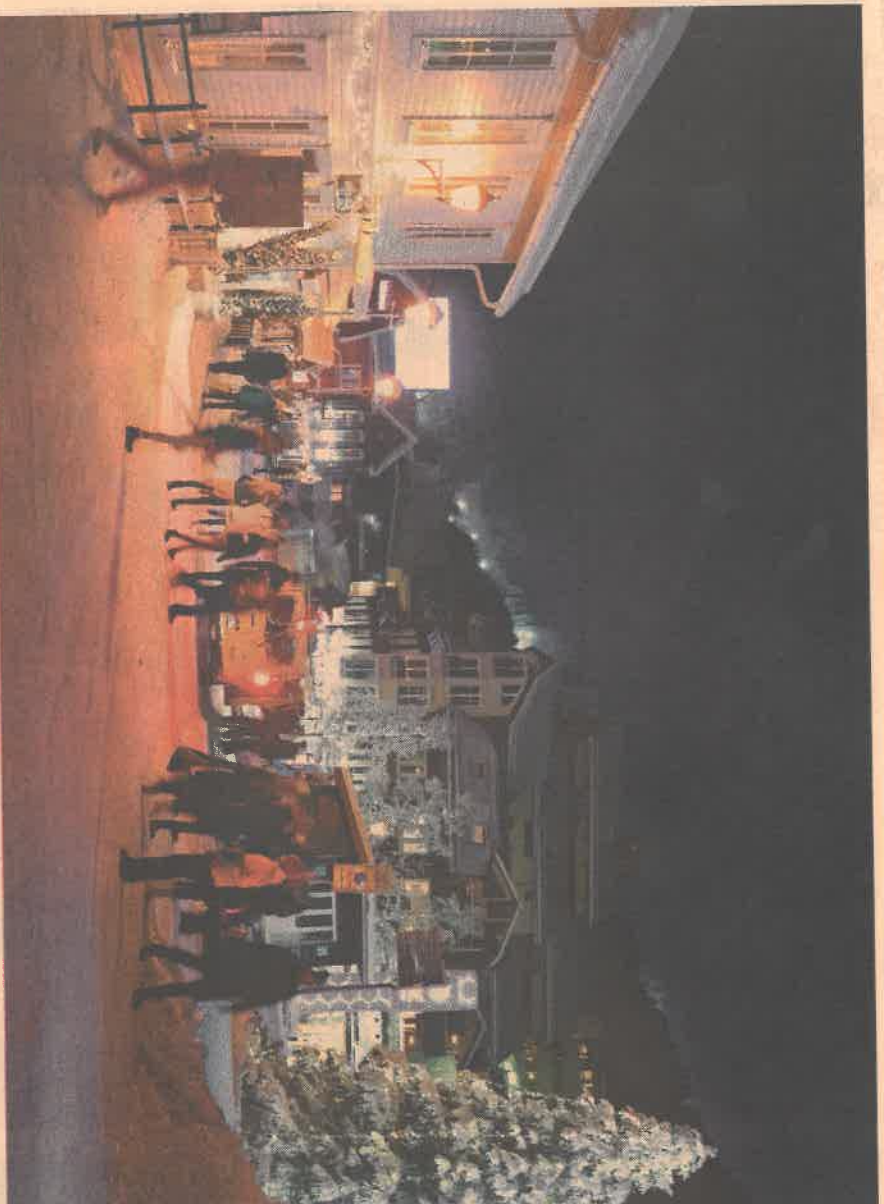
Hovedgaden i Åre minder med sine træhuse og lyskædeklædte grantræer om en hyggelig, stor udgave af en julefilm.