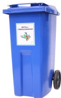
190 liters kärl