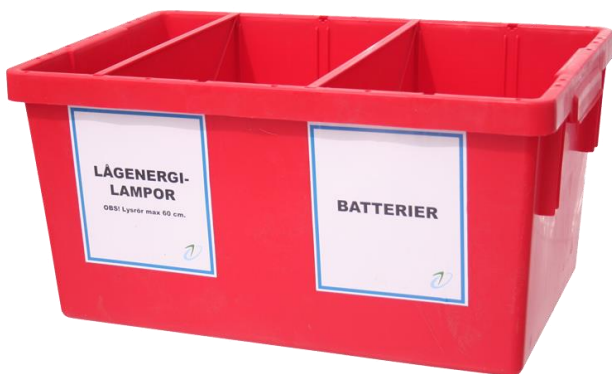
42 liters box