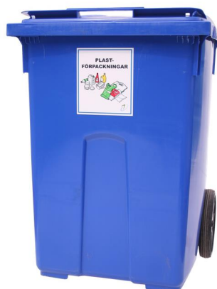
370 liters kärl