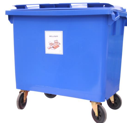
660 liters kärl