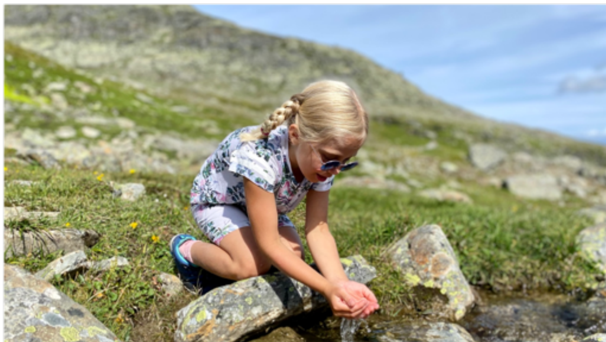
Barn vid fjällbäck.

På JHTs styrelsemöte den 11 december 2023 togs beslut om att ansöka om fortsatt medel från Naturvårdsverket för att etablera rollen som regional samordnare för vandringslederna i länet, vilket är ett beslut som också är ett resultat av projektet.