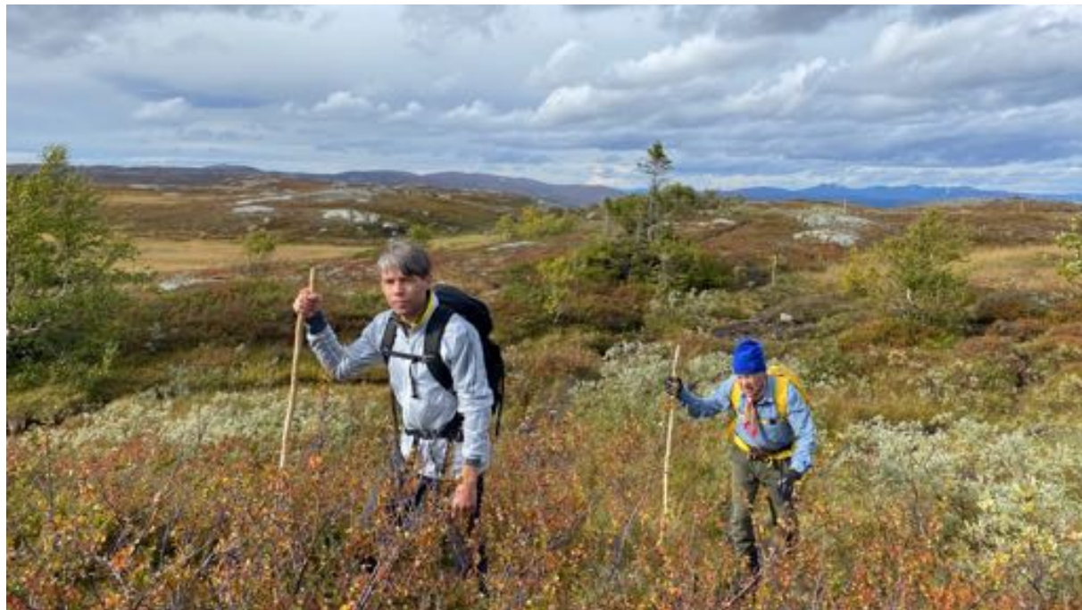
Vandring runt Åreskutan. Far och son.

Om vi räknar lågt och med en underhållskostnad på 4 kr/meter så blir det 10,6 Mkr/år för vandringslederna där staten inte är huvudman i Jämtland Härjedalen. Att anlägga en spång kostar ca 250-500 kr/metern, flis ca 100 kr/metern och ett vindskydd kan kosta ca 700 000 kr. Då är det inte inräknat någon kostnad för övrig administration som t.ex. inventering och projektledning. En artikel som beskriver utmaningarna kring detta finns på https://jht.se/vem-ska-betala-for-vara-vandringsleder/