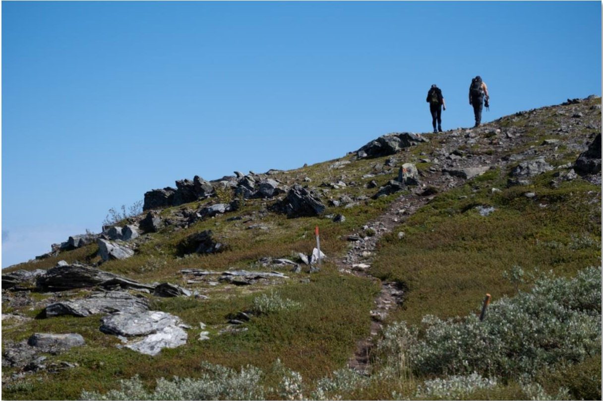
Vandringsled i fjällmiljö i Jämtland Härjedalen.