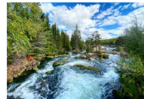
Bodsjöströmmen. Foto: Jennifer Gresseth

I naturreservat, nationalparker och på golfbanor har man ofta valt att begränsa allemansrätten. Ta reda på vad som gäller.